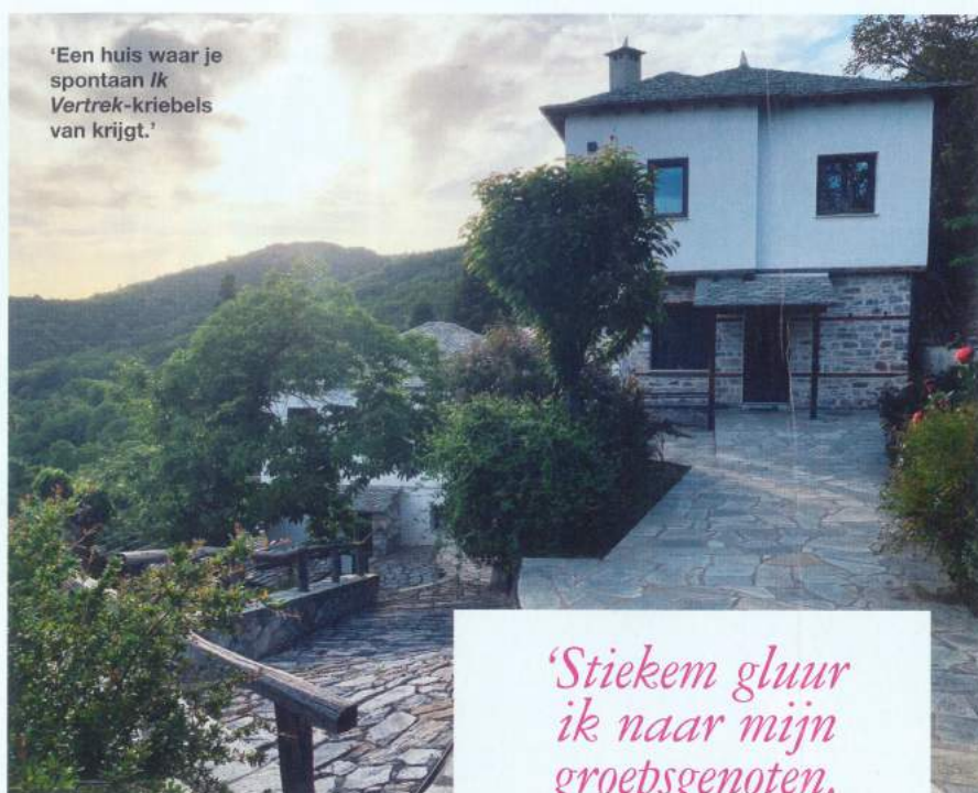
'Een huis waar je spontaan Ik Vertrek -kriebels van krijgt.'

Bij zonsopgang sta ik slaperig in de yogazaal. Na een serie oefeningen doen we een geleide meditatie. Ik val